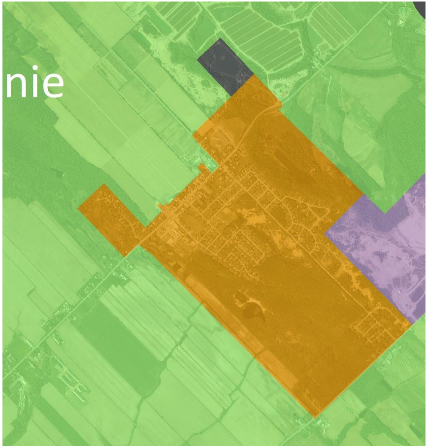
A-2 : Cartographie schéma révisé reg MRC Joliette # 461-2019