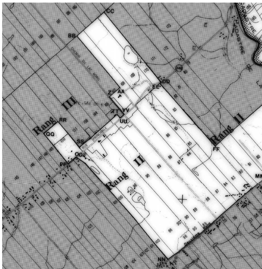
A-3 : Extrait plan zone agricole CPTAQ